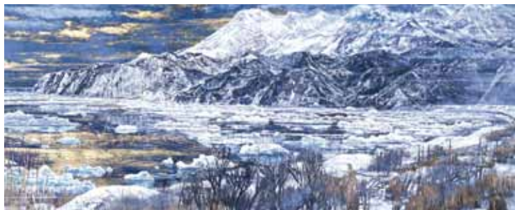
「知床早春」 1996年 第81回院展 1215mm×2834mm