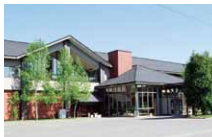
北海道上富良野の「後藤純男美術館」