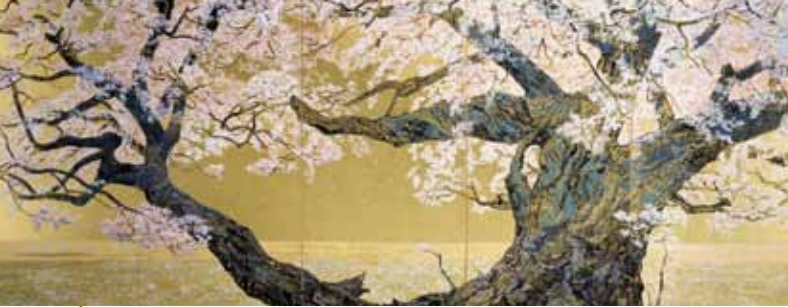
「桜花浄苑雙図」 2002年 1790mm×8800mm