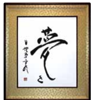
日野原重明氏の書 同時展示